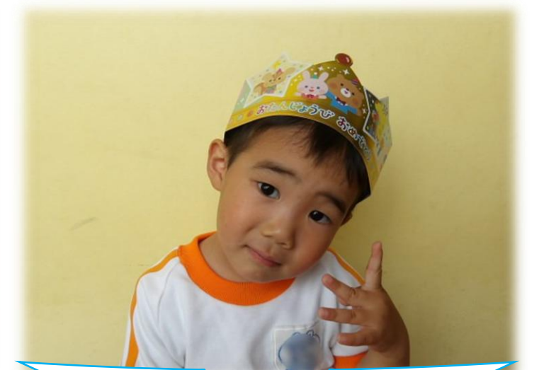
3さいになりました!