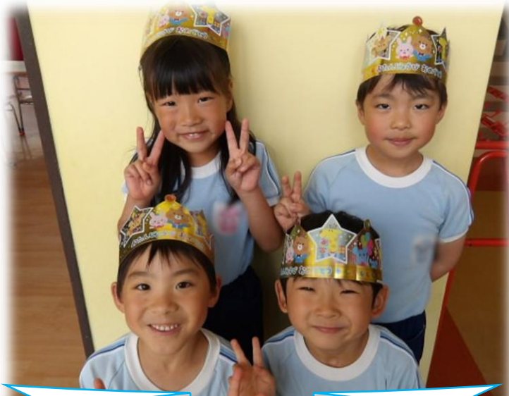
6さいになりました!