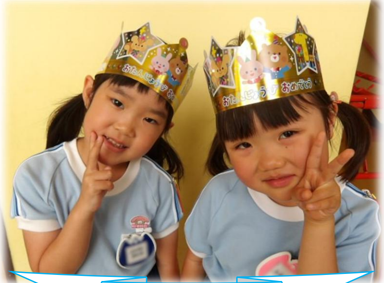
5さいになりました!