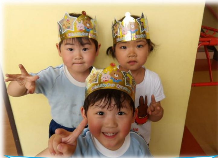
4さいになりました!