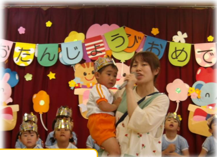
お友だちからカードのプレゼントをもらったよ♪