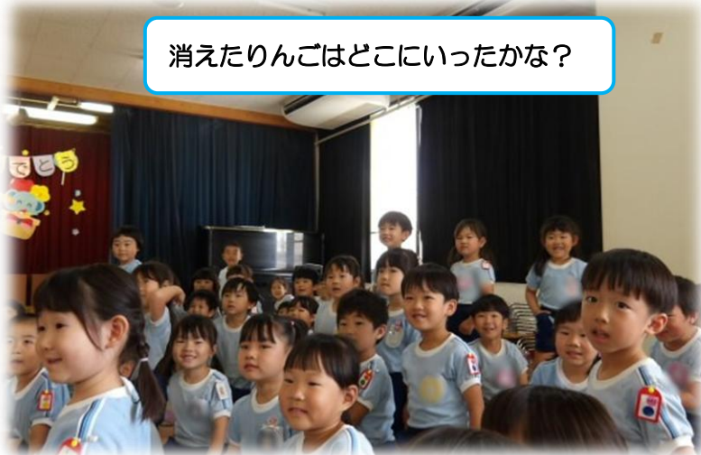
消えたりんごはどこにいったかな？