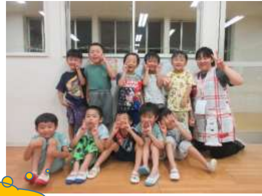
パジャマでハイポーズ♪