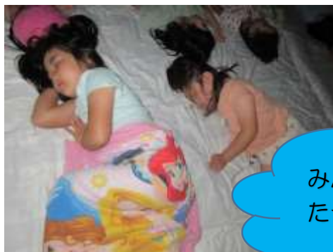
みんなぐっすり眠りました☆