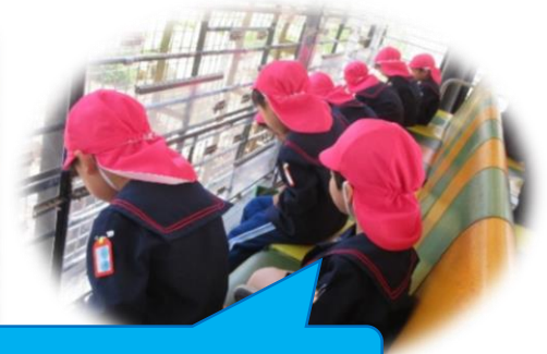
どんな動物に会えるかな～？