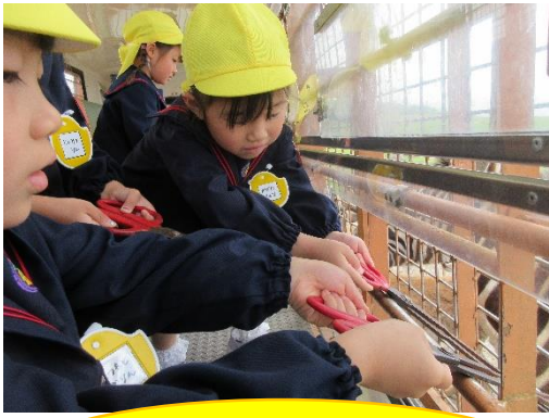
ハサミ上手に使えたよ!