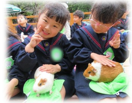
食べてくれるかな？