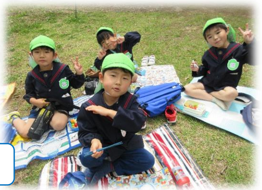
お弁当もみんなで美味しく食べたよ☆