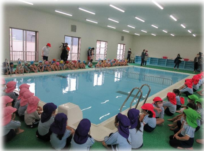
園長先生がお清めをしてくれました！

5月20日（金）に2年ぶりとなるプール開きを行いました。園長先生が安全祈願の清酒とお塩をまき、全園児でプールでの安全をお願いしました。その後は担当教師から、プールでのお約束についての話を聞き、みんなで安全に楽しくプールを使うことができるように確認をしました。この日を楽しみにしていた子どもたちは、真剣にお話を聞いていました。 お話の後は、学年ごとに室内温水プールで思いっきり楽しみました。今後もコロナ対策をしっかり行いながら、安全に十分配慮し、子どもたちが楽しくプール遊びを行えるようにかかわっていきたく思います。