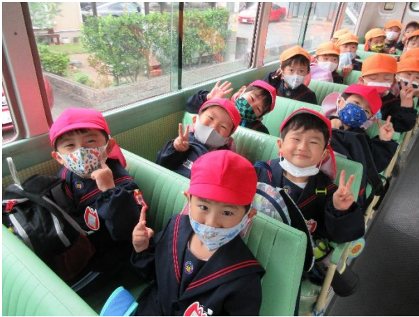
バスに乗って出発！

10月21日(木)に、年少組にとっては初めてみんなで遠足に出掛けました。「あと何回寝たらラクテンチ？」と、この日を楽しみにしていた子どもたち。当日は、はりきっている様子が見られました。たくさんの動物や乗り物に子どもたちは興味津々！アヒルの競争では「頑張れー！」と応援する姿が見られたり、ふれあい動物ランドではウサギやヤギに餌やり体験もしました。始めはドキドキして、動物になかなか触れられなかった子どもも、少しずつ慣れていき嬉しそうにふれあう姿が見られました。この日は少し風が冷たく小雨が降ってきましたが、子どもたちは夢中になって遠足を楽しんでくれました。帰りのバスの中では、すぐ寝てしまう子どもが多く、幼稚園に着くまでぐっすりで大満足の1日となりました。