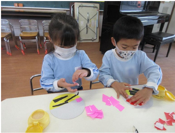
【折り紙を隙間ができないように貼っています】

目や眉毛は、貼りに個性が出ていて、「怖い鬼にした!」「私はこんな鬼!」と色々な表情の鬼のお面が完成しました。豆まき集会で被ることを楽しみにしている子どもたちでした♪