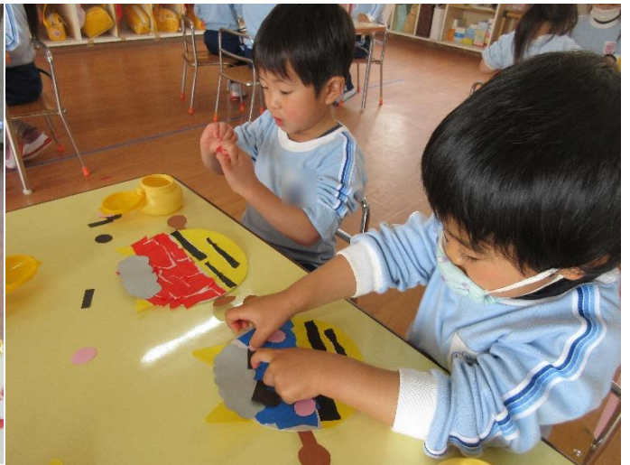
【どんな顔にしようかな?】