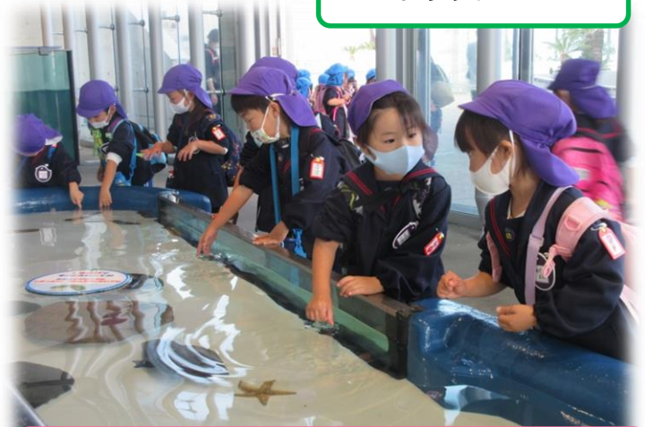
ちょっぴりドキドキだったけど 優しく触ることができました！！