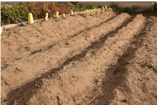
じゃがいもを植える畝（うね）