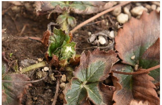
白いつぼみどこにあるかな？