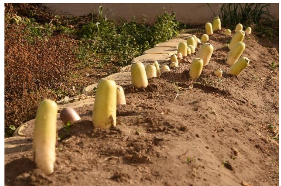
葉っぱを切った大根