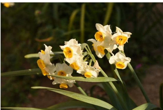
きれいなスイセン！