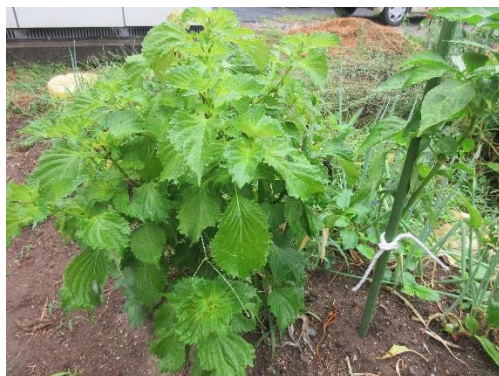
ハーブの仲間、青しそです！