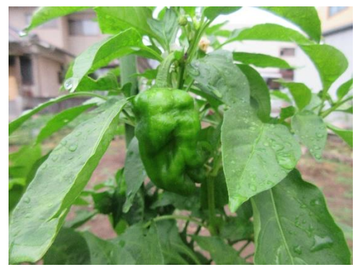
大きなピーマン見つけた！