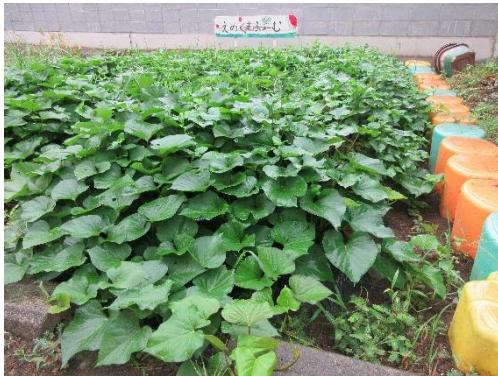
つるを伸ばすさつまいも

畑の周りには他にナス、ピーマン、青しそ、ネギなどの夏野菜も見ることができます。ピーマンの嫌いなお友だちはいませんか？園長先生は大好きです。栄養もあるので食べられるようになってほしいです。