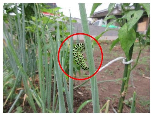
ネギにつかまる青虫