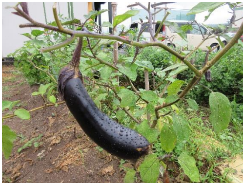
焼きナスにしようかな？