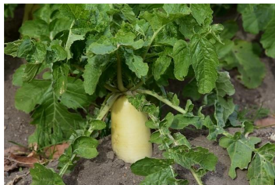
こんなに大きくなりました