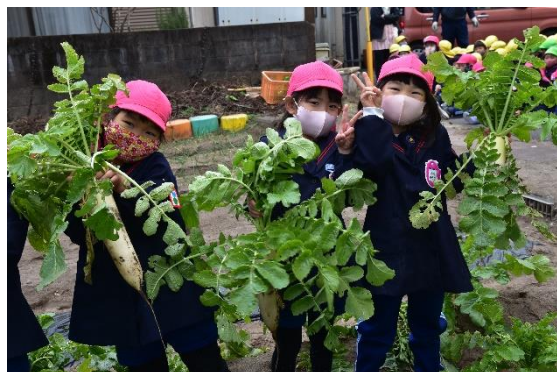
だいこん重たいよお!