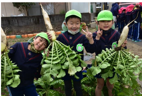
大ききなだいこん!