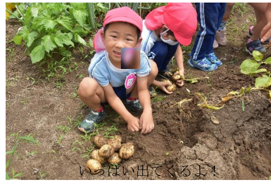
いっぱい出てくるよ!