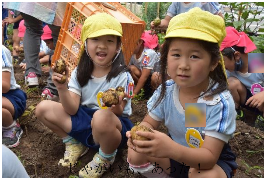
じゃがいも あつた!

梅雨に入り雨が心配されましたが、今日は青空ものぞく天気恵まれ、年長さんによるじゃがいもの収穫体験が行われました。じゃがいもは植えてから100日目頃が収穫時期と言われます。年長さんが年中であった2月26日に植えてから今日で110日目を迎えます。土をかき分け丸い大きなじゃがいもが顔を出すと、子どもたちから何度も歓声が湧き上がりました。中には一人で10個以上も掘ったお友だちもいたようです。じゃがいもはお土産としてお家に持って帰ります。「カレーに入れて食べたいなあー!」と早くも楽しみにしているお友だちもいました。