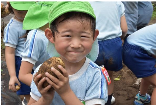
ぼくが一番大きいよ!