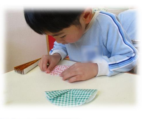
黙々と製作に取り組むこどもたち