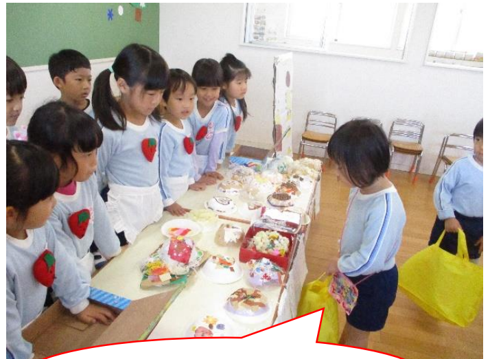
どのケーキにしようか悩むな～