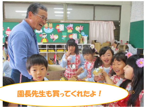
園長先生も買ってくれたよ!