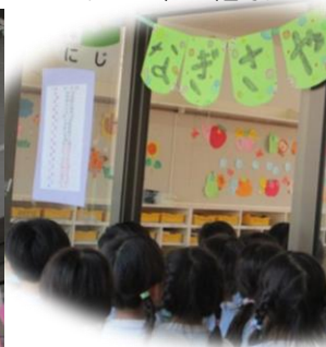
この2日間だけ特別★ 2階のお部屋が【えのくま れすとらん】に変身♪