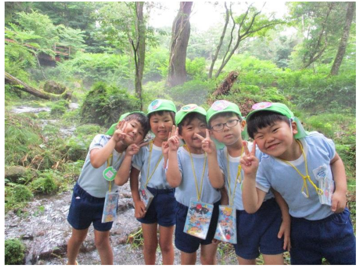
【みんなでハイ、チーズ☆】