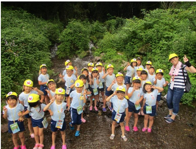
【冷たい川の中に入ってみたよ☆】

久住町にある沢水キャンプ場に出掛けました。幼稚園は、天気が良かったのですが、久住の山に近づいていくと、だんだん雲が出てきました。急遽、雨が降る前にネイチャーゲームをすることになり、子どもたちは自分の図鑑を首から下げ、森の中の散策をしました。冷たい小川に入って遊んだり、木の枝や石など自然物を使って顔を作ってみたり、色々な匂いを嗅いでみたりと、自然の中で五感を使って楽しく遊びました。クワガタやカニ等の生き物もいて子どもたちは大興奮！！みんなで楽しい時間を過ごしました。