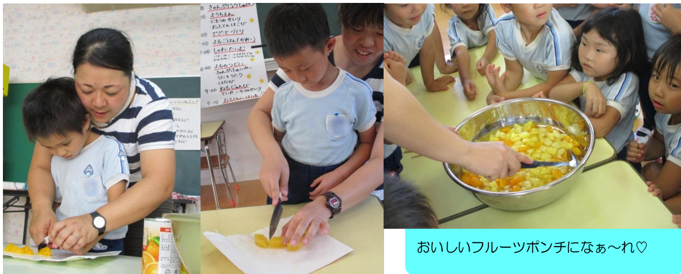
おいしいフルーツポンチになぁ～れ♡

各教室で夕食後のデザート作りをしました。フルーツポンチをみんなで作りしました。先生と一緒に包丁を持って、自分たちでフルーツを切りました。「包丁怖い…」と言っていた子どもも、先生と一緒にだったので、楽しく作ることができました。