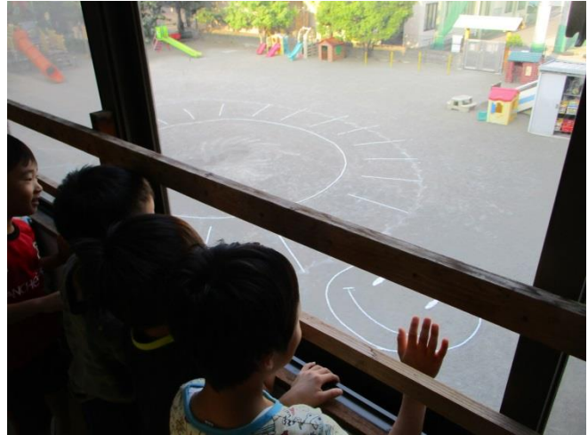
【朝の園庭には、☆とスマイルマークがあるよ】