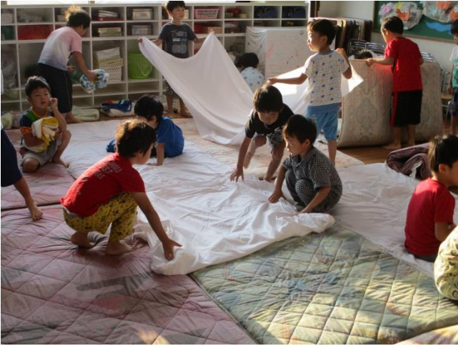
【まだ眠いけど…自分の事は自分でしよう!!】

朝までぐっすり眠った子どもたち。起きてから、お布団の片付けをしたり、園庭にある6つ目の七不思議を見つけたりと、元気いっぱいでした！その後、えのくまファームへ行き、野菜の収穫もしました♪