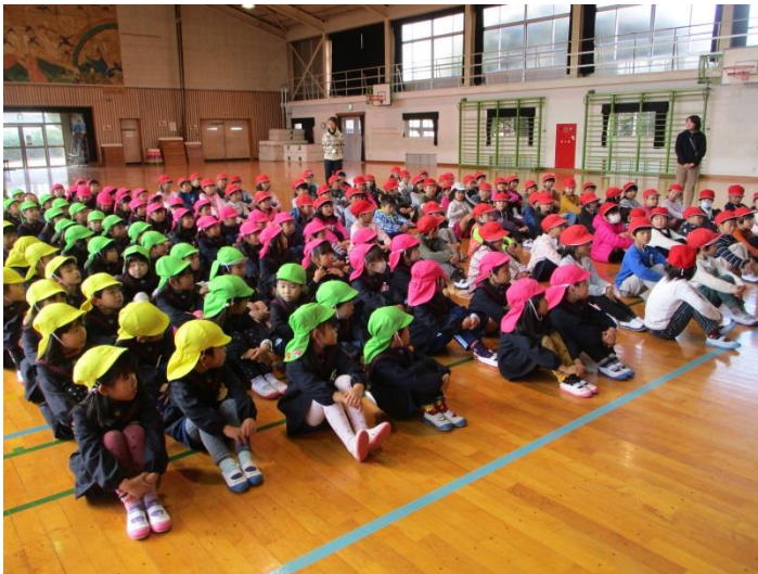
【初めての場所に緊張気味の子どもたちです】

その後、1年生の教室に移動し、国語の授業の様子を見せてもらいました。大きな声で音読をしたり、漢字の練習をしたりと初めて見る授業の様子に子どもたちは興味津々でした！少しの時間でしたが、1年生との交流会を通して、学校や授業の雰囲気も分かり、進学への期待が高まったのではないかと思います。